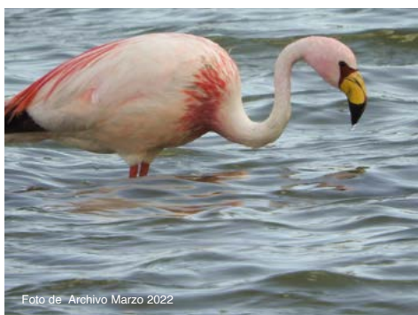
Marzo 2022

necesarias para su permanencia. Los factores que posibilitan su estadía se deberían a que encuentran los recursos alimentarios necesarios, evitando tener que migrar en búsqueda de condiciones favorables para su supervivencia. La ausencia de esta dieta imposibilitaría su presencia”, detalla un informe elaborado por los especialistas catamarqueños de la empresa Andina Consultora Ambiental, que lideraron el monitoreo biológico 2021 que se realizó en MARA Alumbreira.