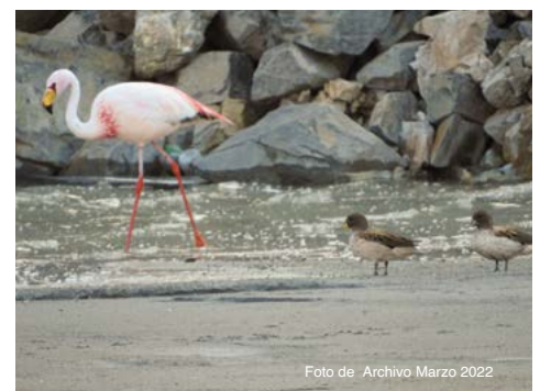
Marzo 2022